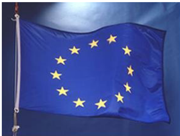
Слика 1. Застава европске уније

„Евројска унија је за мене нова фаза уједињења Евроје, која није ништа друго већ резултат једног континуираног процеса. Стога је тешко већ сада прецизирајти појам Уније. Она треба да се оствари преко институција које ће се прилагодити новим потребама. Уствари, Уније треба да изрази сопствену динамику, путем оснажења и побољшања функционисања институција. У том погледу улога Евројској парламента, чији би посланици требало да буду бирани директним гласањем, биће одлучујућа у развоју Уније“ (Гордана Илић-Гасми, Право и институције Европске уније, 2010, стр.31)